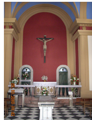
Estado final tras la actuación, Capilla. MC Conservación y Restauración S.L.U.

Respecto a esta obra funeraria diseñada por Ricardo Marcos para La Carriona se puede señalar que si bien el diseño de la planta y del muro perimetral presenta un alto nivel estético, al igual que seis monumentos que proyecta en su interior en la avenida principal, sin embargo en el caso de la Capilla, desciende hacia formas muy elementales.