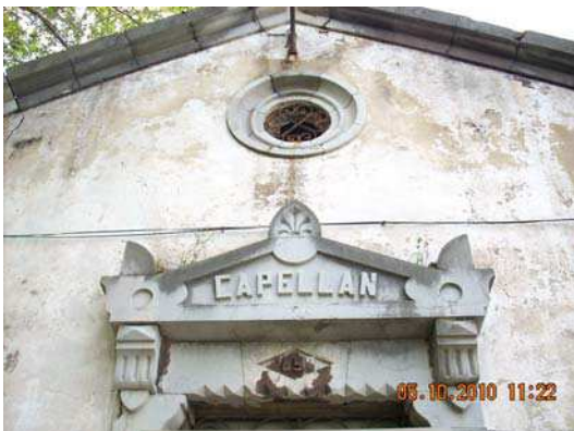
Estado previo a la actuación, Casa del Cura. (izquierda) MC Conservación y Restauración S.L.U.