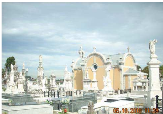
Estado final tras la actuación, Capilla. MC Conservación y Restauración S.L.U.

No obstante se puede afirmar que este conjunto supone sin duda el Cementerio de Arte más relevante de Asturias y en clara pugna por la primera posición dentro del ámbito de la cornisa cantábrica.